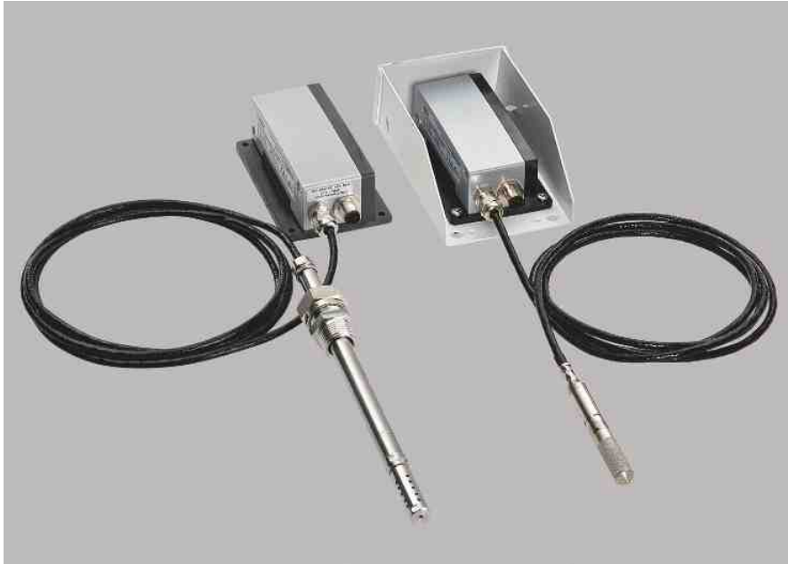
两种探头可选：MMT317和MMT318。另有防雨罩可供选配。